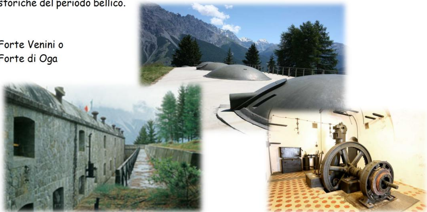
Forte Venini o Forte di Oga

Raggiunte le Torri di Fraele, ci porteremo in pullman all'abitato di Oga dove potremo visitare l'omonimo forte, una struttura militare della Grande Guerra che, ristrutturata e ancora in buono stato di conservazione, contiene interessanti manufatti ed importanti testimonianze storiche del periodo bellico.