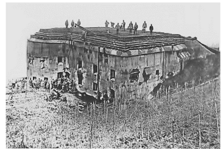
Forte Saccarana (Zacarana) o Tonale