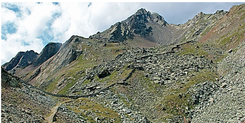
L'intero sbarramento difensivo visto da est, sullo sfondo il Monte Coleazzo.