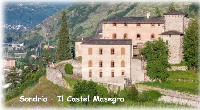
Sondrio - Il Castel Masegra