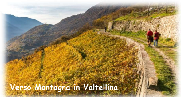
Verso Montagna in Valtellina