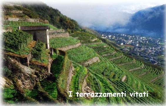
I terrazzamenti vitati