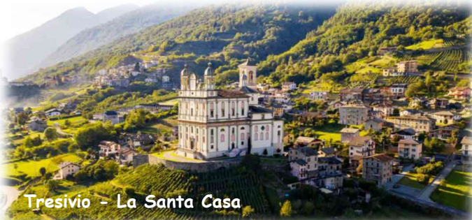
Tresivio - La Santa Casa

Descrizione itinerario: partiamo da Piazza Vittoria e ci dirigiamo verso Ovest, seguendo i cartelli gialli ed i segnavia bianchi e rossi. Attraversiamo la parte bassa della Val di Rohn, caratterizzata dalle coltivazioni del melo, e in un'ora e mezza circa raggiungiamo Tresivio. Il cammino ne costeggia la parte alta da cui si possono ammirare la Santa Casa di Loreto ed il "Calvario", a sud. Proseguendo tra vigneti e tratturi raggiungiamo Poggiridenti Alta e la Chiesa del San Fedele. Da qui, attraversando l'abitato, si raggiunge Montagna in Valtellina e, risalendo il ripido "Risc dei mort" si giunge alla Chiesa di San Giorgio. Da Montagna si gode una splendida vista sul Castel Grumello e la vicina Chiesa di S. Antonio alla quale scendiamo abbandonando la Via dei Terrazzamenti. Dopo la meritata sosta, riprendiamo il cammino che, attraversando vigneti, ci porta a Sondrio, presso il Castel Masegra. Il programma prevede la visita al Museo della Montagna, il CaSt o Castello delle Storie. L'escursione si conclude con la discesa al cimitero di Sondrio ed all'antistante parcheggio.